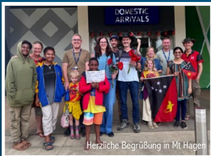
Herzliche Begrüßung in Mt Hagen

Und ja, nach vielem Hin und Her und Abwägen der damit verbundenen enormen Zusatzkosten, dem Sinn und Zweck der Reise, konnten wir am 5. März dann doch über Südkorea nach PNG fliegen.