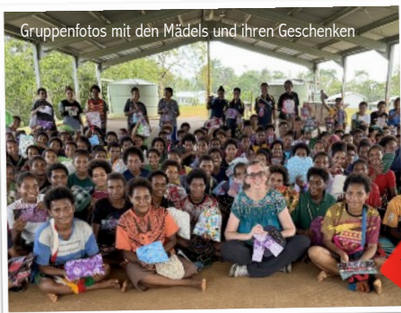
Gruppenfotos mit den Mädels und ihren Geschenken