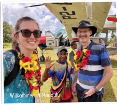
Willkommen in Mougulu