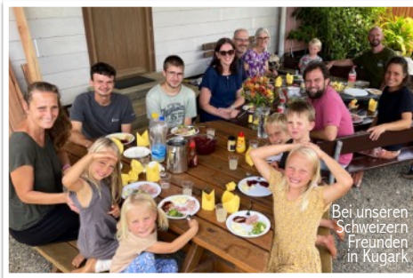
Bei unseren Schweizern Freunden in Kugark

Na, wie fühlt sich das an? Durch unsere verspätete Abreise hatten wir genau diesen Stress!