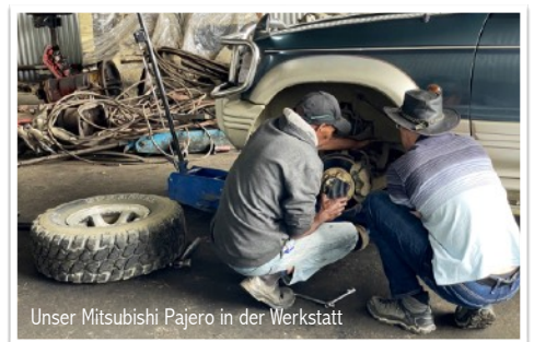
Unser Mitsubishi Pajero in der Werkstatt

Liebe Freunde haben uns ihr Auto für unsere Hochlandtour spontan ausgeliehen, sodass wir rechtzeitig zum Retreat unserer Schweizer Missionsfreunde fahren konnten. Tags drauf war die Straße wegen einem massiven Erdbeben gesperrt.