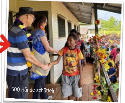
500 Hände schütteln!