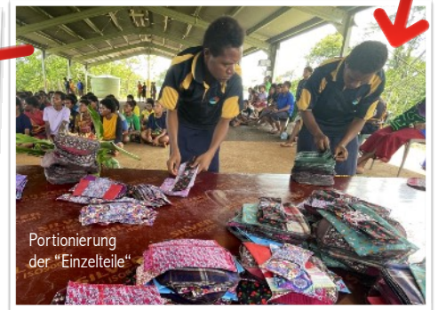
Portionierung der "Einzelteile"