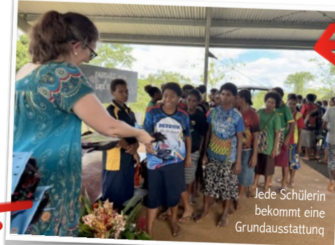
Jede Schülerin bekommt eine Grundausrüstung